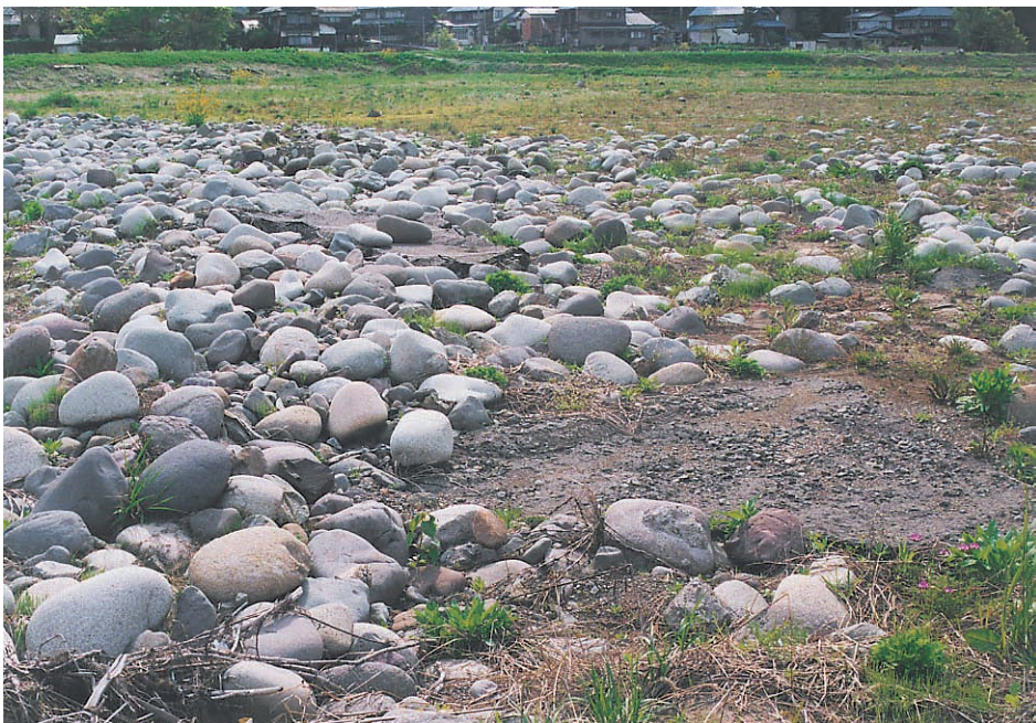
写真6：美山町高田の谷底平野の田圃に流れ込んだ土石。この田圃は耕作が放棄されている。