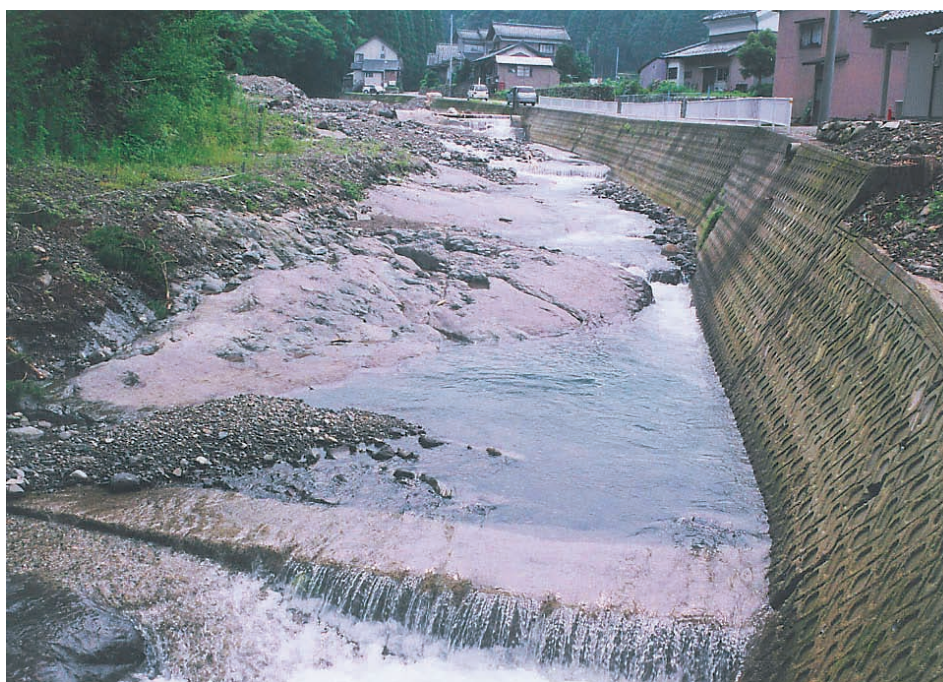
写真3：浄教寺地区の一乗谷川。水害前は土砂に埋まっていた河川岩盤が現在は露出している。今後上流から流れてくる土石により再度埋没するかも知れない。