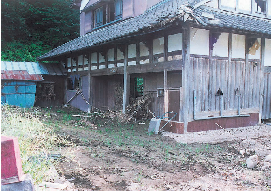
写真10 ：足羽川から溢れた泥水に浸された住居。この住居は水害後しばらくはそのままであったが、最終的に撤去された。