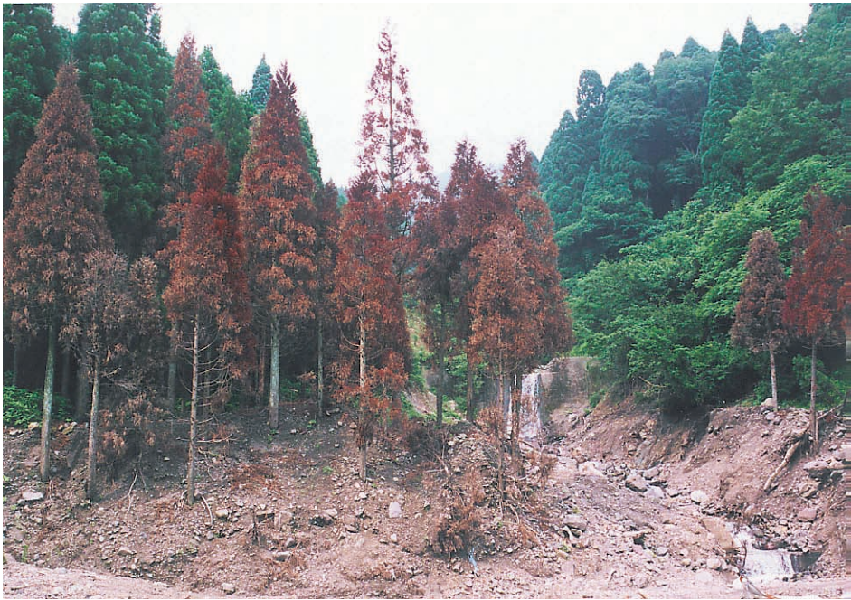
写真7：土石流に打たれて枯れる杉（池田町水海）。