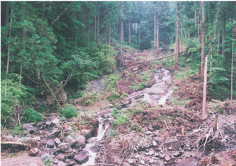
写真14：写真13の渓谷の同じ場所を1年後に同じアングルで撮影した写真。手前にあった杉は伐採されている。溪流の出口にはサイズの大きい礫が残されている。土石の吐き出しは明瞭である。福井市一乗谷川上流