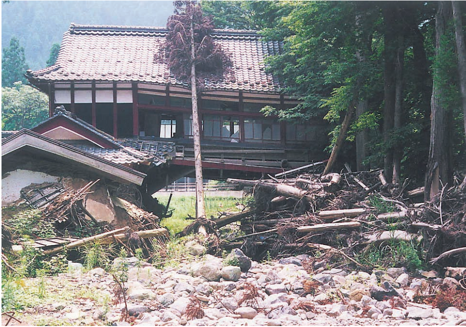
写真9：土石流に襲われ、一階部分がトンネル上になった住居。池田町松ケ谷

住居の1階部分の中央が完全に無くなり、住居の2階部分だけが残り、トンネルのような状況になっている。この住居は使用不可能であり、いずれは撤去されるであろうが、現時点では放置されている。