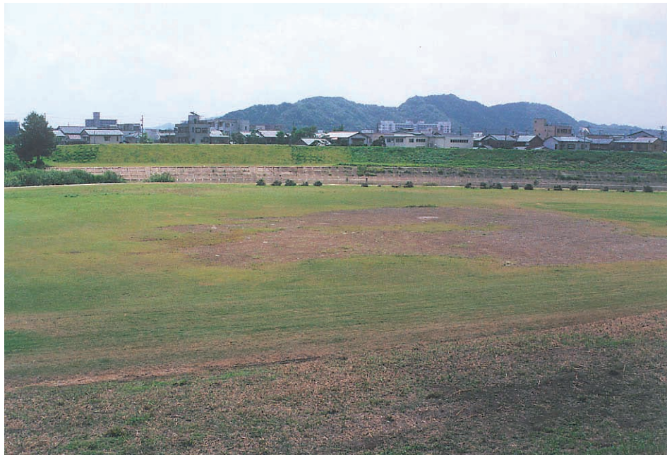
写真1: 復旧なった足羽川破堤現場。対岸の黄緑色の部分が破堤現場。手前の河川敷公園には、剥がれた芝の跡が残っている。

平成16年7月18日の福井豪雨は甚大な被害を引き起こし、福井住民に辛苦を与えた。豪雨から1年を経過した平成17年7月と8月に豪雨被害地を再訪問し、水害1年後の状況を検分した。住民の日常生活はほぼ平常に戻っているが(写真1)、あちらこちらに災害の後遺症が残されている。本文では、豪雨災害1年後の状況について簡単に紹介する。豪雨災害については、各種の調査報告書(高濱, 2005:平成16年7月福井豪雨足羽川洪水災害調査対策検討会, 2005:地盤工学会(平成16年福井豪雨による地盤災害の緊急調査団), 2005:山間集落豪雨災害対策検討委員会, 2005)に詳細に記載されているのでそちらを参照されたい。