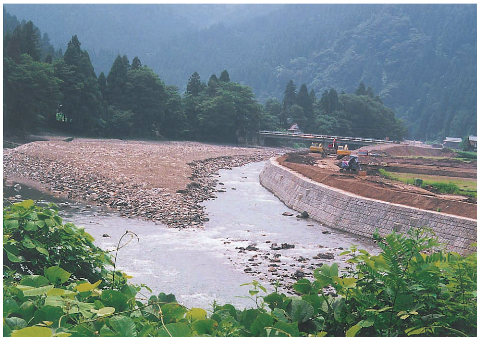
写真2：折立地区の足羽川。河川の復旧はほぼ完了しているが、河川内に残された砂礫は、今後下流へと流れていく。

足羽川河床を2 m程掘削する計画になっている。河床が2 m低くなれば、その分を補うように、上流から土砂が流入する。少し長いスパンで見れば、最終的な平衡に達するまで、土砂が下流へ下流へと移動していく。