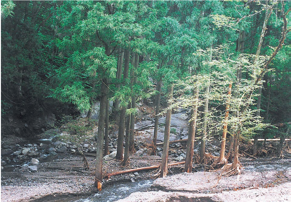
写真13：水害直後の土石流出口。出口の杉はまだ生きている。渓谷出口には比較的細かい土石が堆積している。