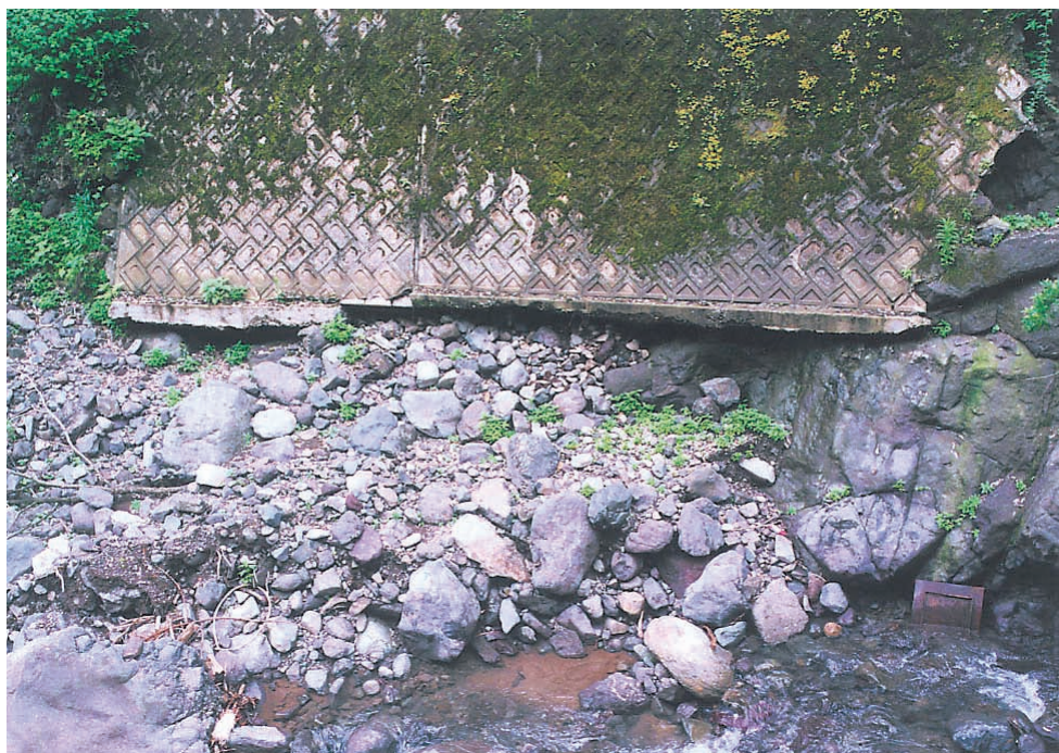
写真4：河床の土石が流出し、浮き上がった護岸壁（浄教寺地区）。今後も土砂が運び去れることにより、あちらこちらでこのような護岸壁の浮き上がりが発生するであろう。

足羽川下流部で河床が2 m低くなると、やがて中・上流部でも2 m河床が低くなる。中流部では、足羽川の両岸には護岸壁が設置されている場合が多い。護岸壁が岩盤上に設置されている場合は問題ないが、護岸壁の下部が土砂であると、その部分はやがて流出し、護岸壁が浮き上がった状態になり、護岸壁の崩落の原因となる。このことを防ぐには、土石流下防止の堰堤の設置が有効である。