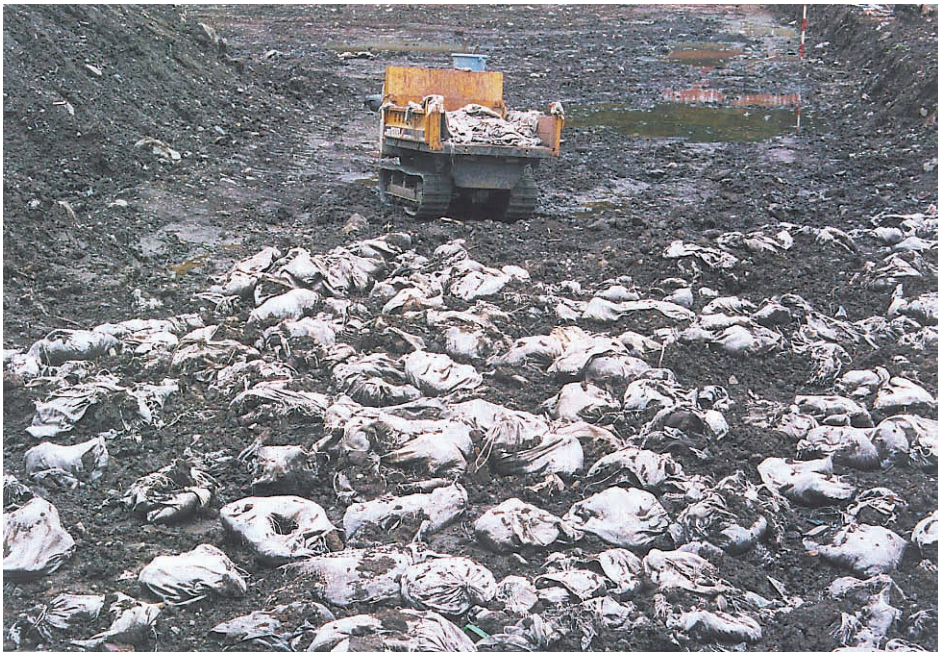
写真12：浸水を防ぐために使われた土嚢も現在ではゴミとなっている。土嚢は袋と中味の砂とを分離して，処理されている。（鯖江市河和田）