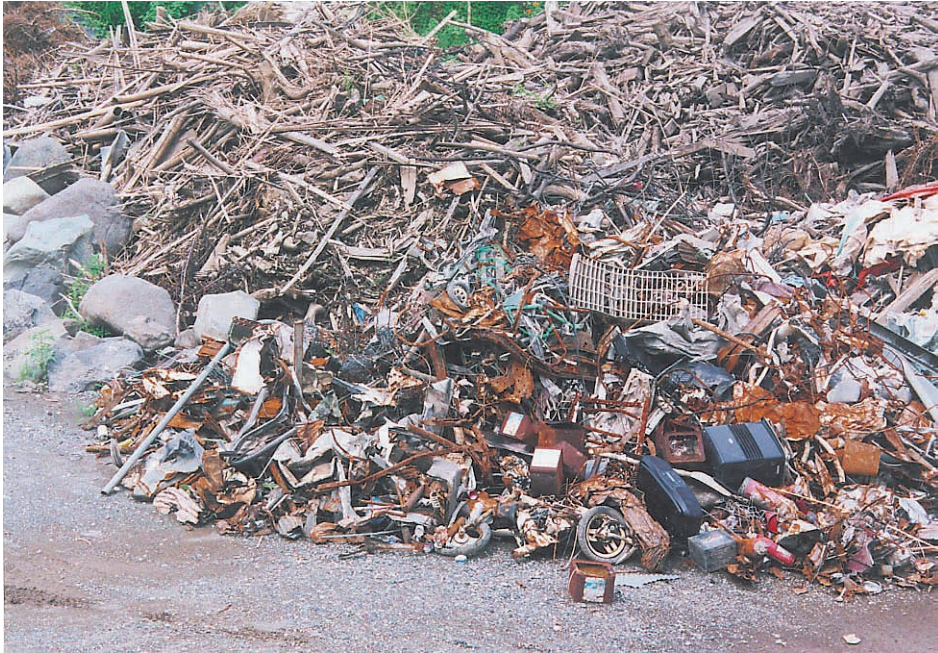
写真11：水害1年後にも排出，積み上げられる水害ゴミ（福井市朝倉資料館横）. このようなゴミの山があちこちに残されている。