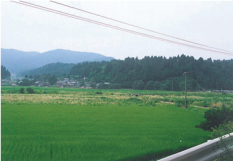
写真5：美山町高田の足羽川谷底平野。手前は稲が見事の生育しているが、写真中央は田圃が放棄され、雑草が生い茂っている。この部分は土石が流れ、堆積した部分。