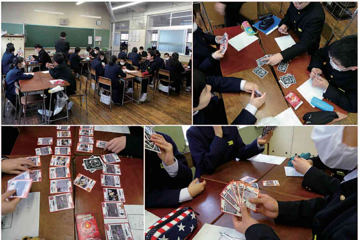
図2. 火成岩カードを用いた授業の様子。

Q12は、火成岩カードゲームに対する感想の自由記述欄である。生徒らの感想を表2に示す(重複分は削除)。グループA・Bともに概ね肯定的な感想であり、「楽し