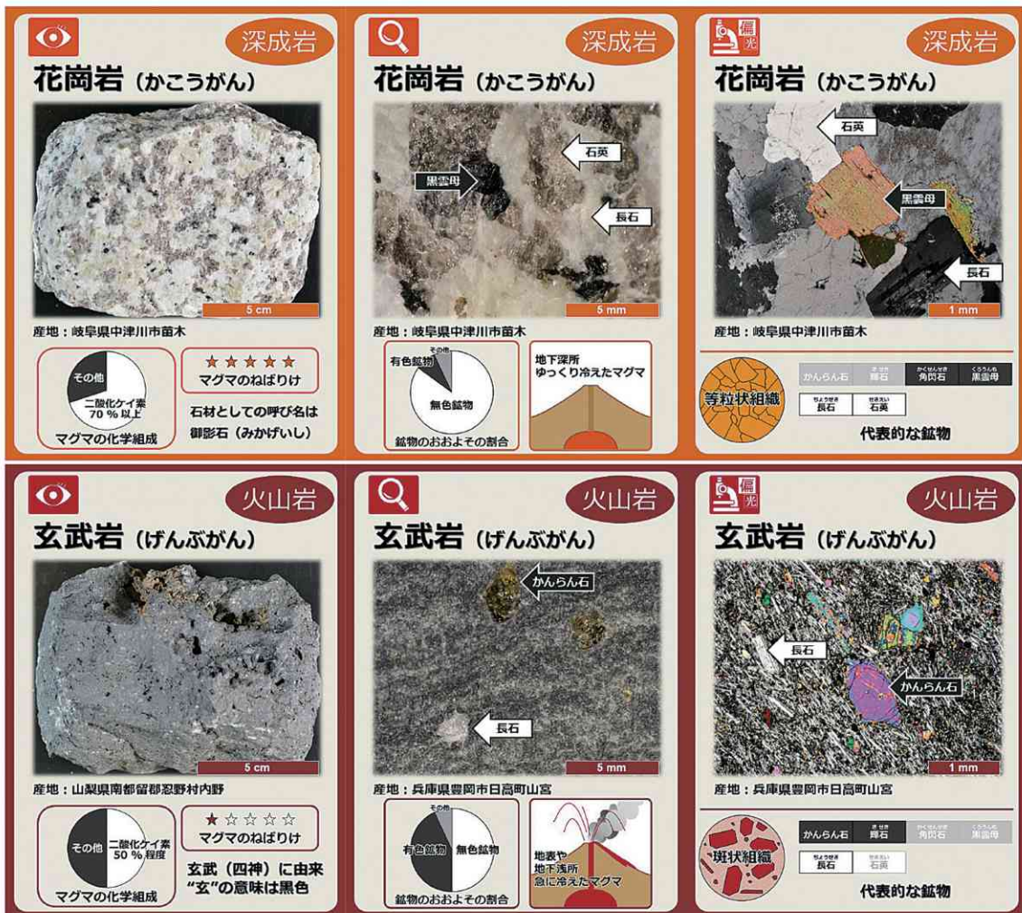
図1. 火成岩カードの例.

福井市明道中学校1年生2クラス48名を対象に、火成岩カードを用いた理科授業を実施した。授業担当者は、