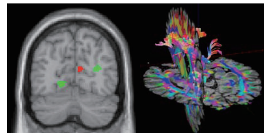
図4(左). 脳領域の容積の違い